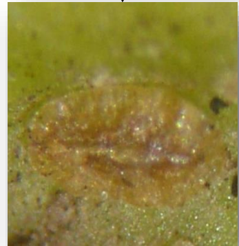
Uitgedroogde wittevliegnimf 48h na toepassing Limocide